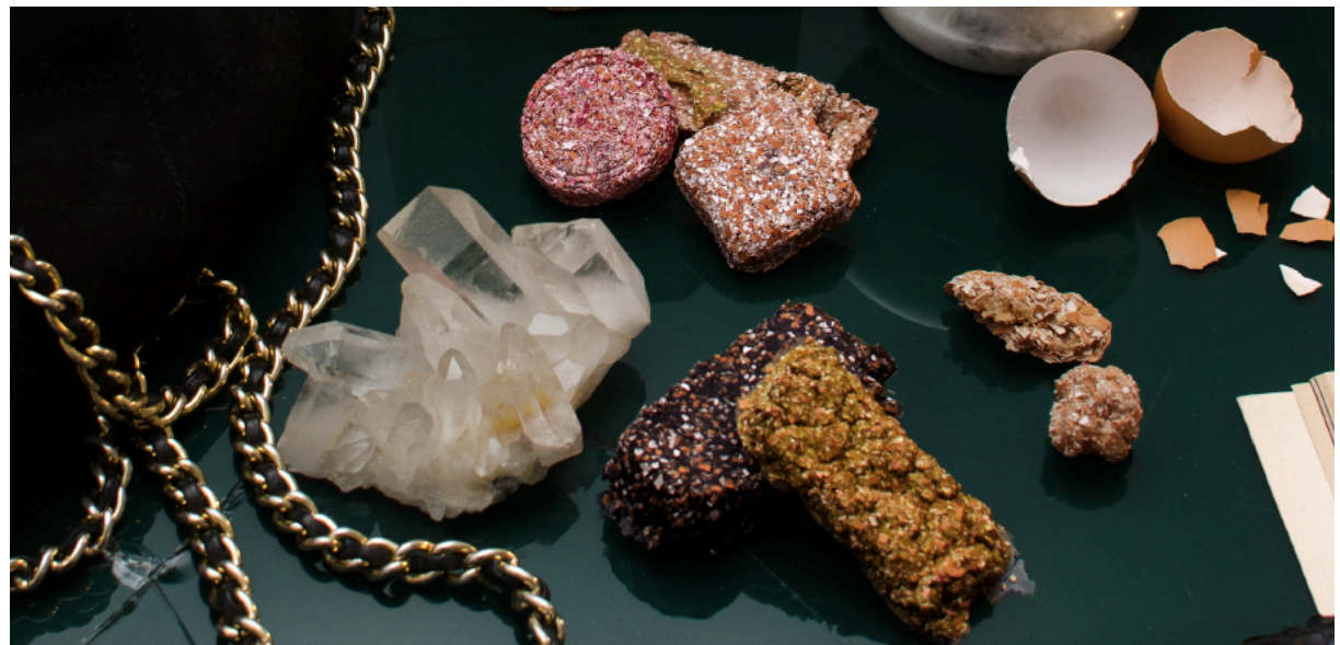
Cibo materia By Giada Martinelli