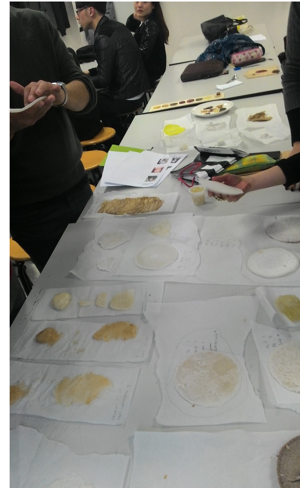
Alcune fasi del processo di ideazione di un DIY Material