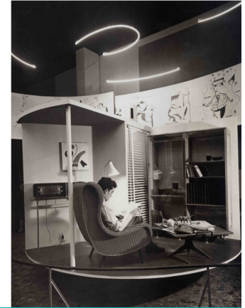
I fratelli Castiglioni con Munari per la Rai (1952)