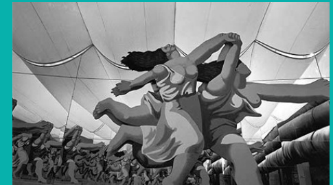
Aulenti, La corsa al mare, 1964