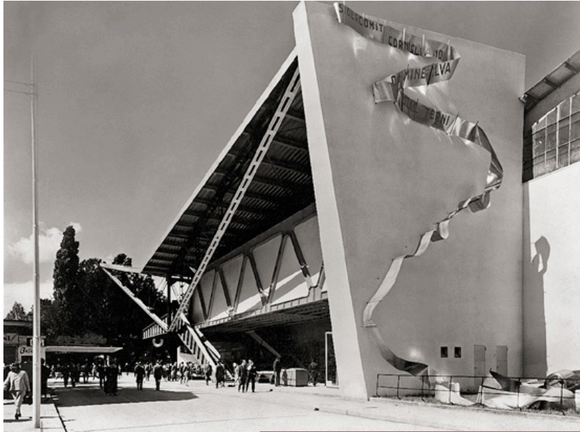
Baldessari con Lucio Fontana per la Sidercomit (1963) e per la Breda (1951)