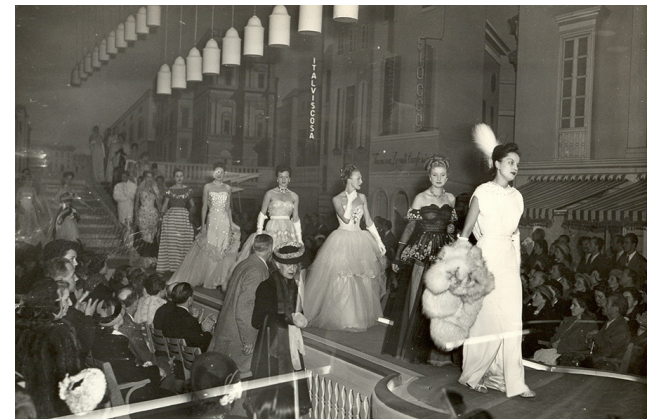
Padiglione dei tessuti (1948)