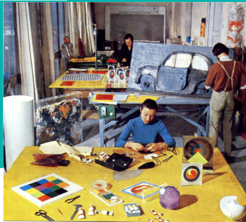
Polimero Arte (1970)