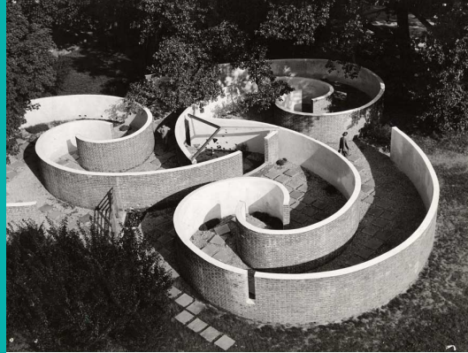
Rogers con Steinberg, Calder, Labirinto dei bambini, 1954