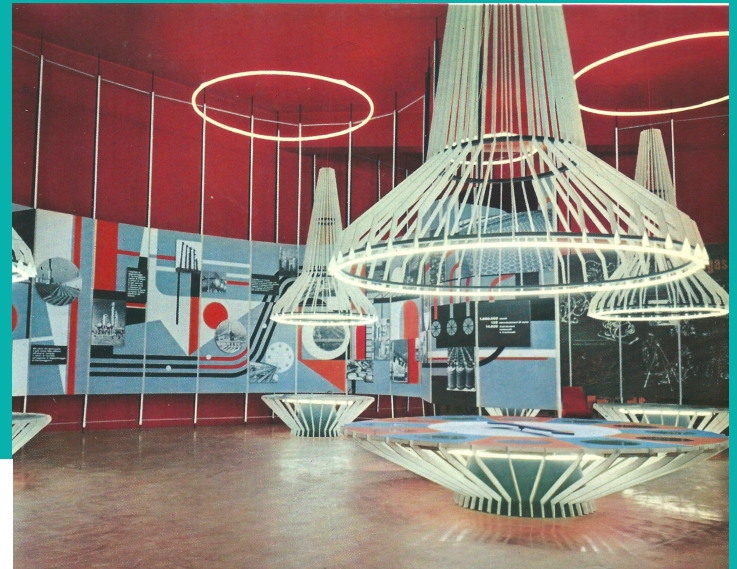
Erberto Carboni (1955)