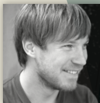
11.10 Davide Mottes Editorial design Il Sole 24 Ore