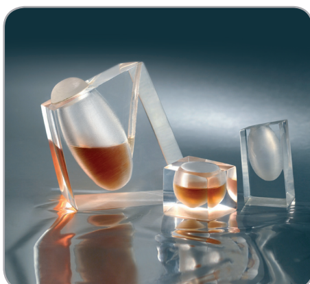
1° premio "Tea for two" 2009 Nebojša Momčilović - Serbia