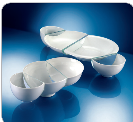
1° premio "Snack-Bowl Set" 2006 Katalin Tomay - Ungheria