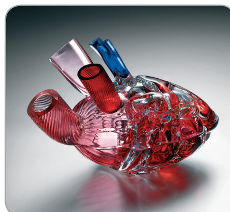
1° premio "Dish with a Lid" 2007 Dirty Design Studio - Repubblica Ceca