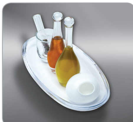
1° premio "Cruet Set" 2005 Marie Rahm - Austria