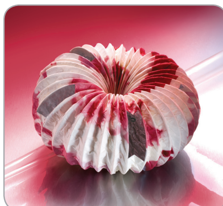
1° premio "Cookie Jar" 2008 Stefan Gudev - Repubblica Ceca