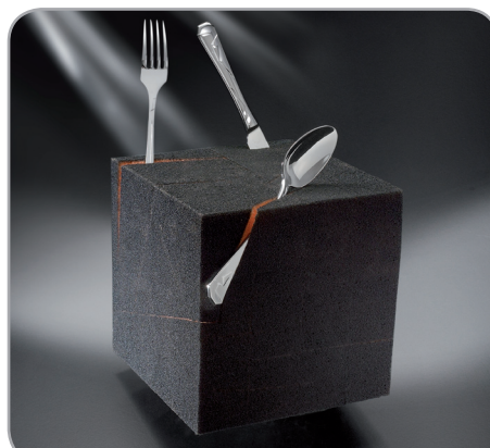
1° premio "Box for everything & nothing" 2011 Leona Matějková - Repubblica Ceca