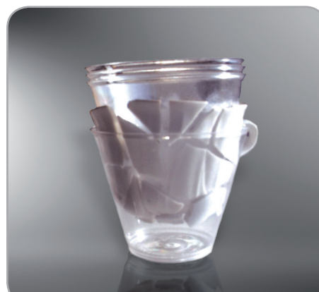
1° premio "Cup" 2004 Slobodan Roksandic- Serbia